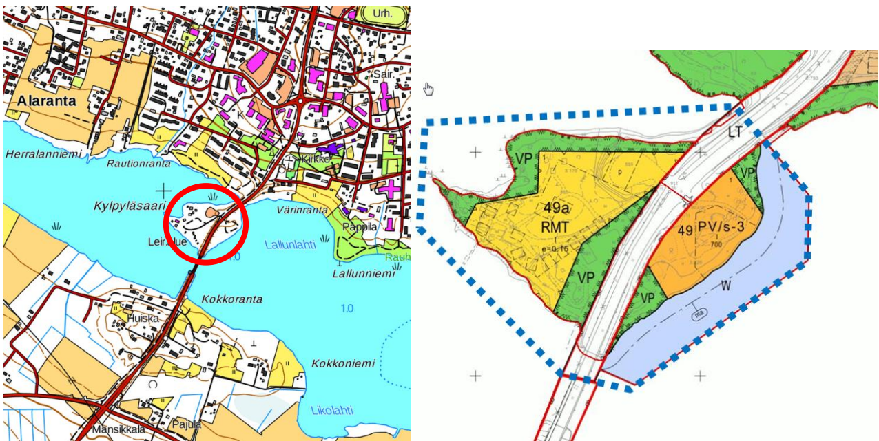
Kaavamutosalueen, 6,5 ha, sijainti ja rajausta asemakaavakartalla.

Suunnitelmassa kerrotaan maankäyttö- ja rakennuslain 63 §:n mukaisesti, miten osallistuminen ja vuorovaikutus sekä kaavan vaikutusten arviointi tapahtuvat kaavaprosessissa.